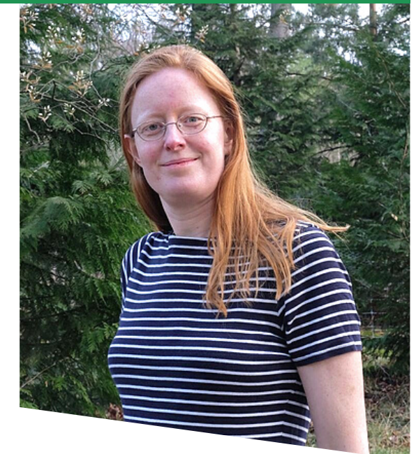
Bestuurslid Wetenschap Aios bedrijfsgeneeskunde