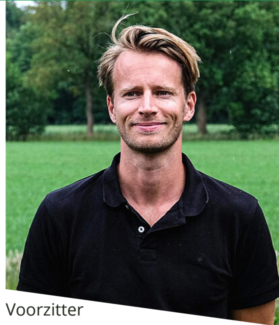
Voorzitter Aios M+G, profiel JGZ