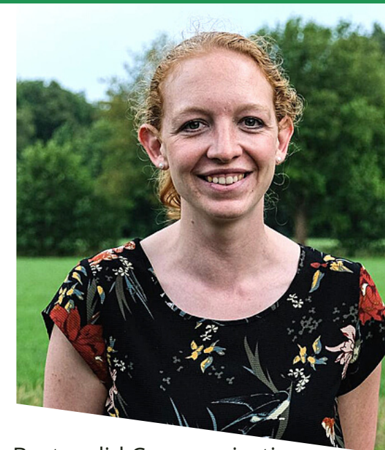
Bestuurslid Communicatie Aios bedrijfsgeneeskunde