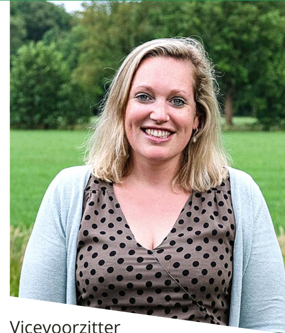
Vicevoorzitter Bestuurslid Onderwijs Aios M+G, profiel JGZ