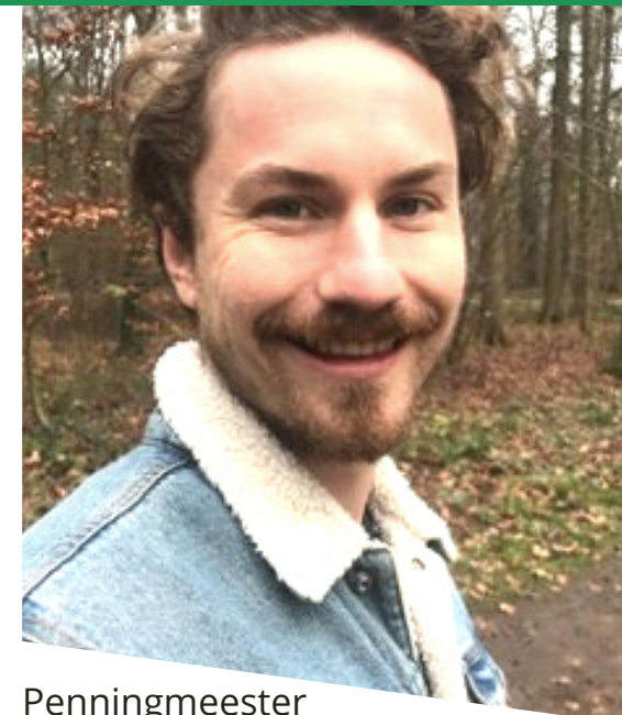
Penningmeester Aios M+G, profiel IZB