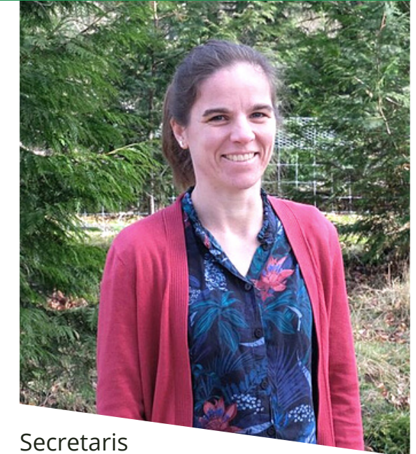
Secretaris Aios M+G, profiel JGZ